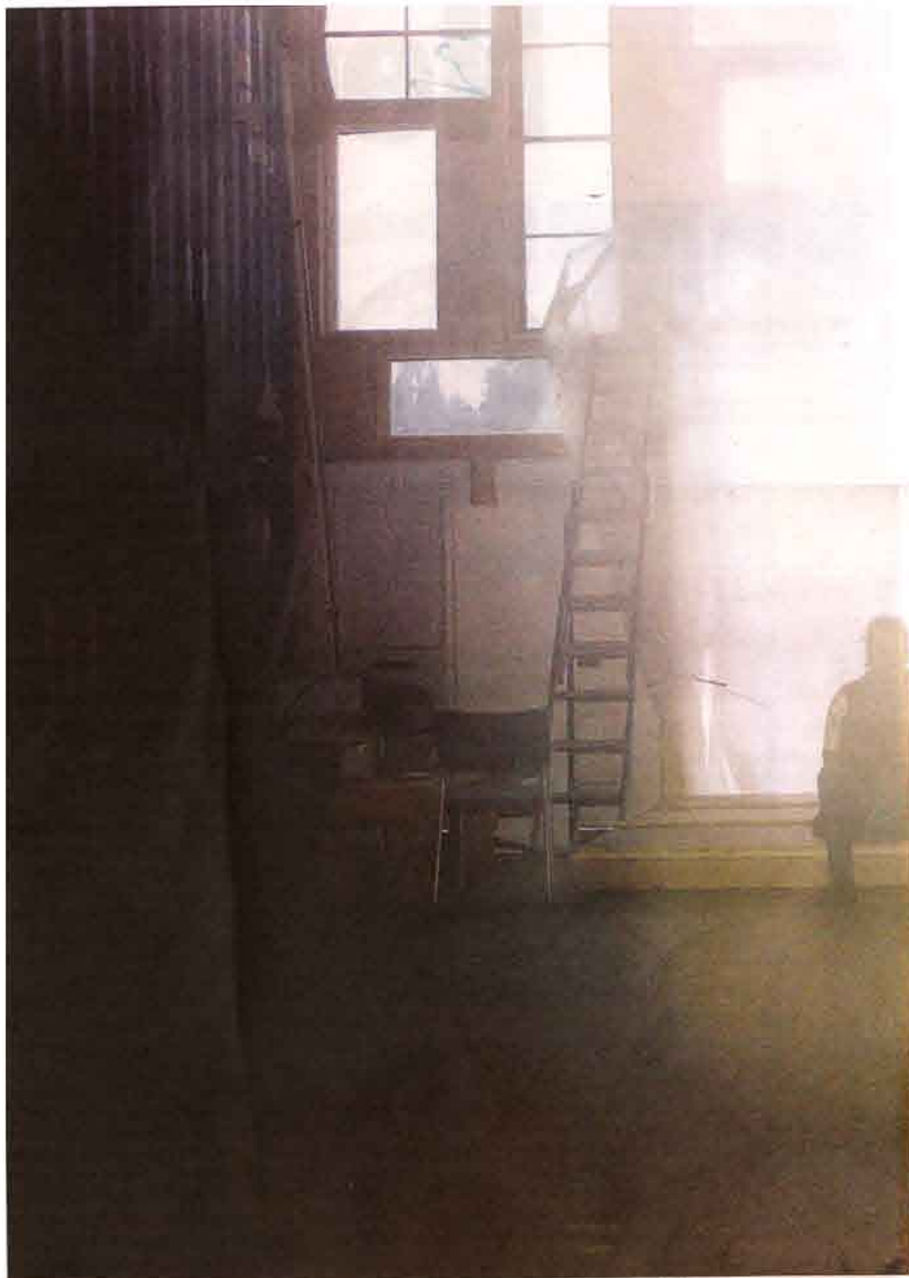
Inuti huset är det ännu bara ett stort rum, men när allt är klart ska här sjuda av olika aktiviteter.

Två dagar senare körde polisen ut dem. Efter ytterligare