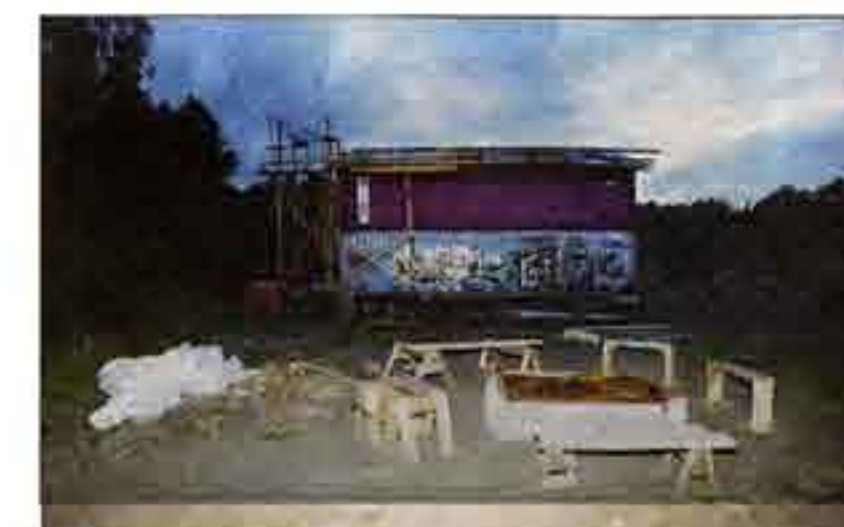
Huset byggs ihop av containrar och gammalt byggmateriel man fått tag på.